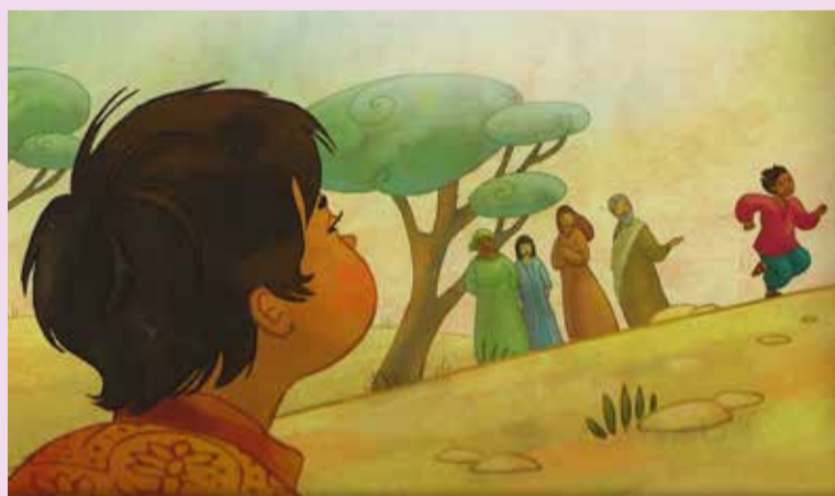
Detail uit een tekening in 'Kinderen van God': aartsbisschop Desmond Tutu vertelt zijn lievelings-bijbelverhalen, met illustraties van tekenaars wereldwijd.

WIJKPASTOR PROTESTANTSE WIJKGEMEENTE ZOETERMEER-ZUID